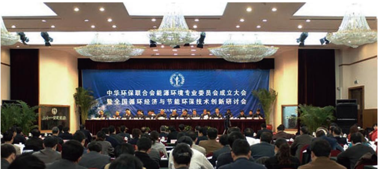
中华环保联合会能源环境专业委员会2006年12月16日在京成立

组织开展和协调能源系统共同参与能源环境事业及公益活动；加强社会监督，致力于能源工业实现国家能源发展和环境保护目标，维护我国良好的能源工业国际环境形象，推动全人类环境事业及节能环保产业的进步和发展；组织开展能源环境行业教育培训和环境评估技术服务，开展国际交流合作，推广能源环境新技术。