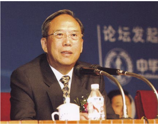
国务院副总理曾培炎在中华环保联合会成立大会上讲话

主要任务： 团结、凝聚各社团组织以及各方面的力量，共同参与和关爱环保工作，加强环境监督，协助和配合政府实现国家环境目标、任务，维护公众和社会环境权益，促进中国环境事业发展，参加国际民间环境交流与合作，维护我国环境国际形象，推动全人类环境事业的进步和发展。