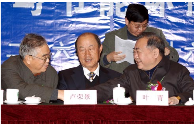
联合会秘书长曾晓东同能环委顾问卢荣景、叶青亲切交谈

全国政协常委、原安徽省委书记卢荣景同志，全国政协常委、原国家计委副主任叶青同志，原司法部党组成员、中纪委驻司法部纪检组长韩灵同志，中华文学基金会副会长兼总干事、原作家协会书记处常务书记张锲同志，中国机械工业联合会副会长、原国资委监事会主席贾成炳同志，原煤炭部党组成员、总工程师陈明和同志，中国人民解放军总后勤部少将、原新兴集团总裁朱作满同志，中国烟草协会会长、原国家烟草局副局长杨传德同志，原煤炭科学研究总院院长张声涛同志等中华环保联合会能源环境专业委员会部分顾问代表；国家发改委能源局正局级巡视员、国务院瓦斯治理部际协调办公室主任吴吟同志，国家环保总局科技司罗毅副司长，国土资源部地质环境司陶庆法副司长；中华环保联合会、中国石化集团、中国石油、中石化、中海油集团、大唐电力、国家电网以及兖矿集团、新汶矿业集团、平煤集团、淮南矿业集团、抚顺煤业集团、济南钢厂、中国煤炭报、中国石油报、中国环境报、中国日报和部分为能源行业服务的企事业单位的代表出席了大会。