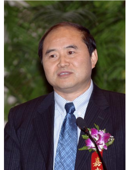
发改委司长吴吟在会上演讲

全国政协常委、原安徽省委书记卢荣景同志，全国政协常委、原国家计委副主任叶青同志，原司法部党组成员、中纪委驻司法部纪检组长韩灵同志，中华文学基金会副会长兼总干事、原作家协会书记处常务书记张锲同志，中国机械工业联合会副会长、原国资委监事会主席贾成炳同志，原煤炭部党组成员、总工程师陈明和同志，中国人民解放军总后勤部少将、原新兴集团总裁朱作满同志，中国烟草协会会长、原国家烟草局副局长杨传德同志，原煤炭科学研究总院院长张声涛同志等中华环保联合会能源环境专业委员会部分顾问代表；国家发改委能源局正局级巡视员、国务院瓦斯治理部际协调办公室主任吴吟同志，国家环保总局科技司罗毅副司长，国土资源部地质环境司陶庆法副司长；中华环保联合会、中国石化集团、中国石油、中石化、中海油集团、大唐电力、国家电网以及兖矿集团、新汶矿业集团、平煤集团、淮南矿业集团、抚顺煤业集团、济南钢厂、中国煤炭报、中国石油报、中国环境报、中国日报和部分为能源行业服务的企事业单位的代表出席了大会。