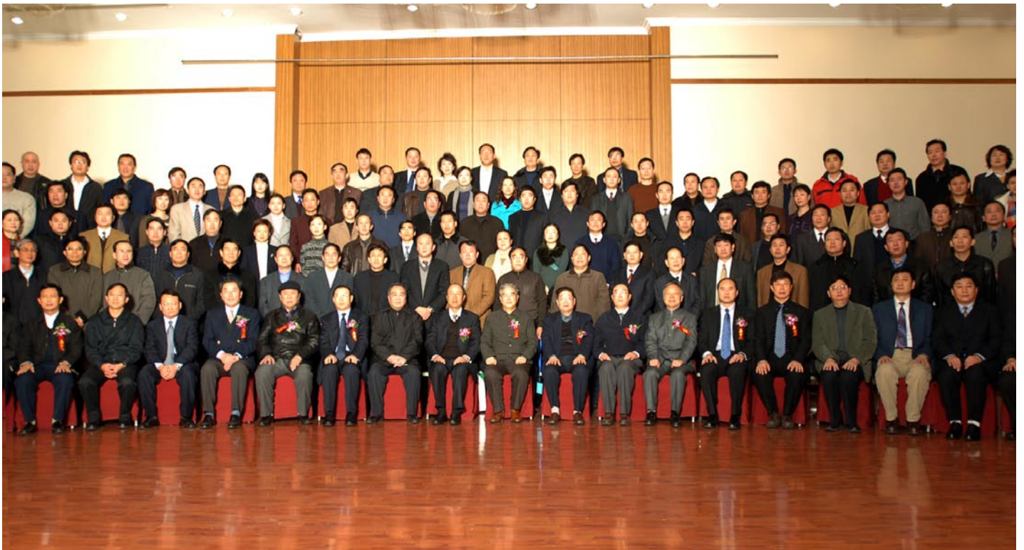
2006年12月16日能源环境专业委员会成立大会代表会后合影