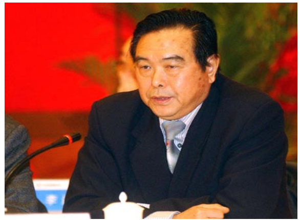
中华环保联合会秘书长曾晓东在成立大会上讲话

中华环保联合会名誉主席顾秀莲（全国人大副委员长）、周铁农（全国政协副主席）、张榕明（全国政协副主席）；主席宋健（原国务委员、全国政协副主席、两院院士）、副主席毛如柏（全国人大环资委主任）、陈邦柱（全国政协人资环委主任）、解振华（国家发改委副主任）等；理事会由全国人大、全国政协、国务院各部委及地方政府的有关领导和各方面知名人士组成；常务理事中正、副部级以上领导146人。秘书长曾晓东（中纪委派驻国家环保总局纪检组组长、党组成员）。